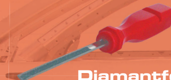
Diamantfeile Art.-Nr. 358118