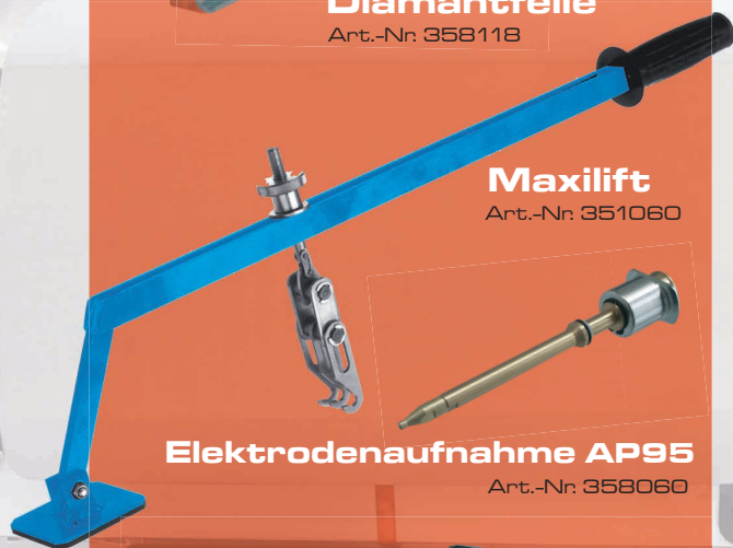
Maxilift Art.-Nr. 351060