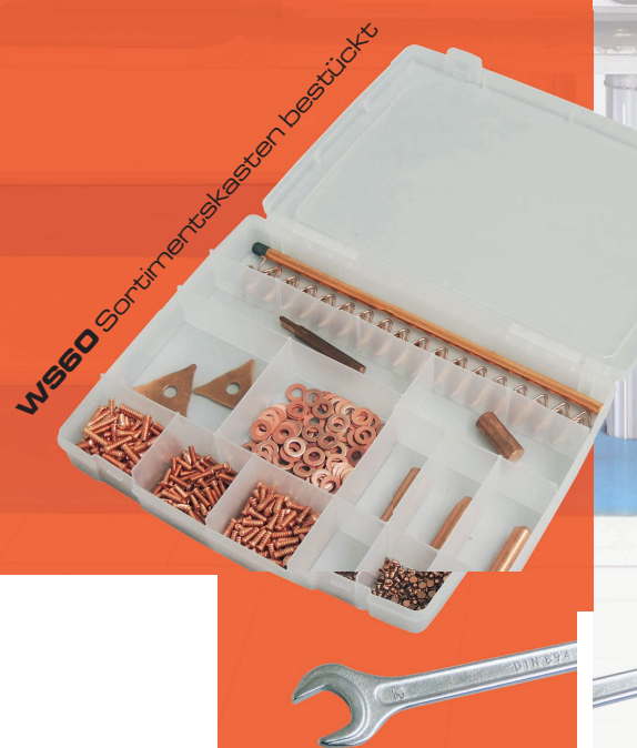
WS60 Sortimentskasten bestückt

Schweißfunktion für U-Scheiben, Bolzen, T-Stifte und 3-fach Bleche