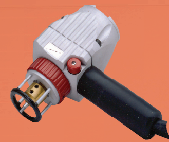
Airpuller AP95 Art.-Nr. 351001