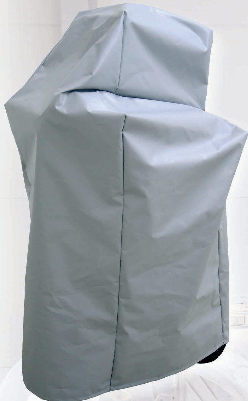
Abdeckhaube WS60 Art.-Nr. 352061